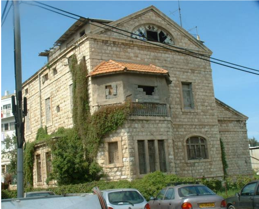
חזית קדמית חלונות אטומים, ויטרז' שבור, תוספות בנייה

שטח הבניין כ-700 מ"ר. המבנה בנוי באבן. בשתי קומות ועליית גג. למבנה צריח מאבן. הבניין מוגדר כמבנה מסוכן. ניכרים סדקים במקומות אחדים במעטפת החיצונית. כיום המבנה אטום והחללים הפנימיים במצב מדורדר. יחד עם זאת ניתן עדיין להבחין בפרטי בנייה מקוריים ובחלוקת החללים ההיסטורית.