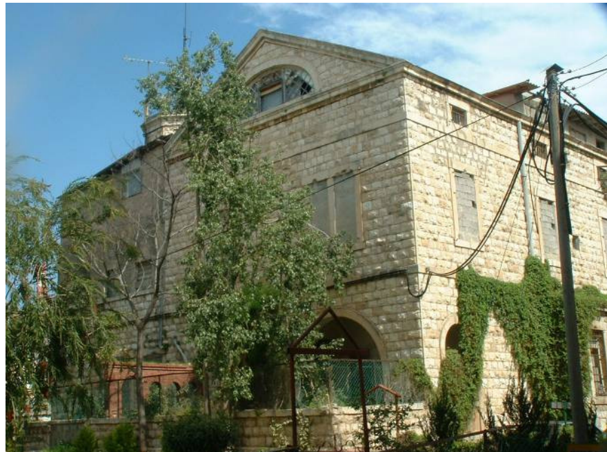
חזית אחורית. חלונות אטומים, ויטרז' שבור